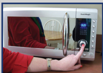
Horno de Microondas Parlante