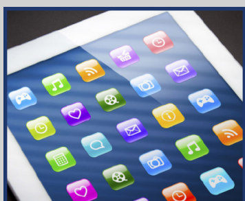
Tableta Digital Mostrando Aplicaciones