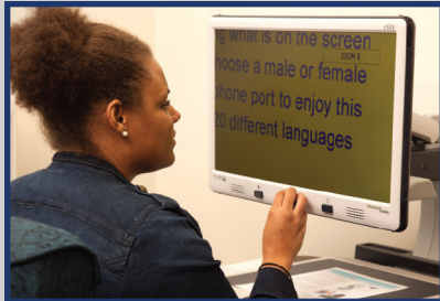
Lupa de Vídeo de Escritorio