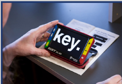
Dispositivo de Amplificación Portátil