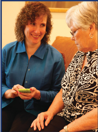
Dos Mujeres Hablando