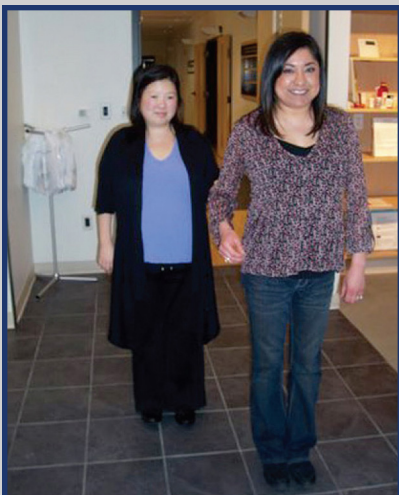
Guiando a una Persona por Espacios Interiores