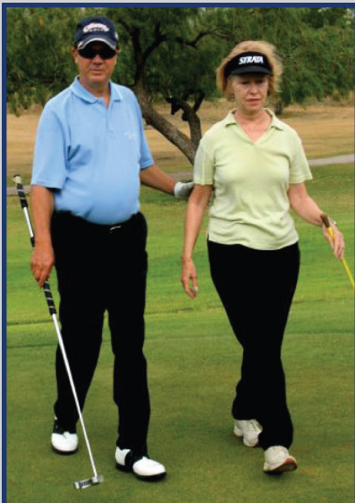
Guiando a una Persona por Espacios Exteriores