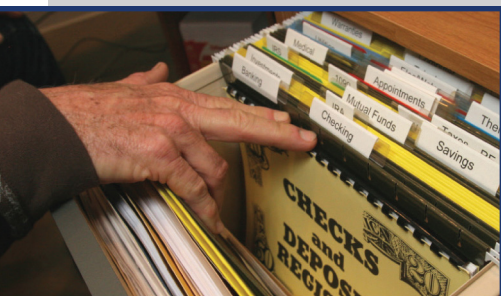
Etiquetas para Archivos con Letras Grandes