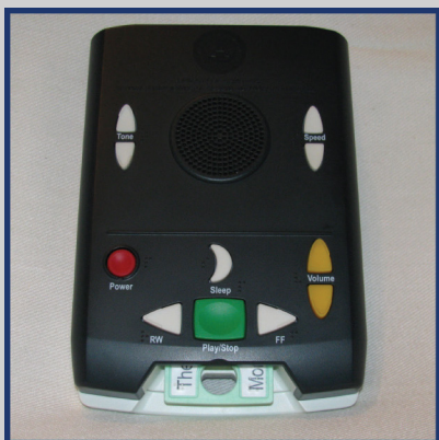
Máquina Lectora de Libros