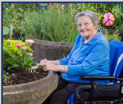
Jardinería en Contenedores en una Mesa de Fácil Alcance