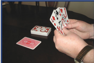
Naipes con Letras Grandes