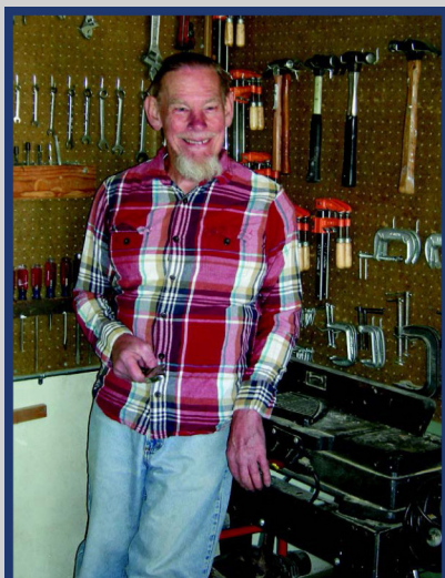
Tratamiento de la Madera

Con algunas modificaciones, usted puede disfrutar de actividades tales como la lectura, los juegos de cartas, los deportes de masas, las manualidades o la artesanía en madera.